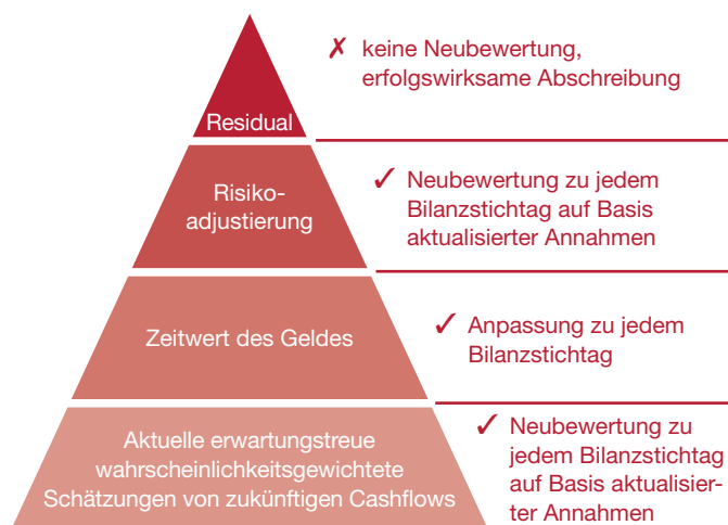
Abb. 3: Bausteine und Folgebewertung

Das vorgeschlagene Bewertungsmodell basiert auf aktuellen Informationen. Die geschätzten Cashflows sind aufgrund der vorhandenen Informationen zu aktualisieren, aktuelle Zinssätze sind für die Diskontierung zu verwenden, und die Risikomarge ist zu aktualisieren. Das Residual darf wie bereits erwähnt nicht aktualisiert werden. Die Veränderung der Verpflichtung ist in der Erfolgsrechnung zu buchen.