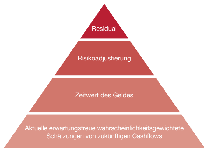
Abb. 1: Der Bausteinansatz des Bewertungsmodelles

Der Bausteinansatz des Modells sieht vor, dass zuerst die Cashflows, danach der Diskontsatz, anschliessend die Risikoadjustierung und eventuell noch das Residual bestimmt werden.