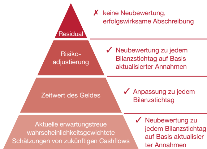
Abb. 3: Bausteine und Folgebewertung

Das vorgeschlagene Bewertungsmodell basiert auf aktuellen Informationen. Die geschätzten Cashflows sind aufgrund der vorhandenen Informationen zu aktualisieren, aktuelle Zinssätze sind für die Diskontierung zu verwenden, und die Risikomarge ist zu aktualisieren. Das Residual darf wie bereits erwähnt nicht aktualisiert werden. Die Veränderung der Verpflichtung ist in der Erfolgsrechnung zu buchen.